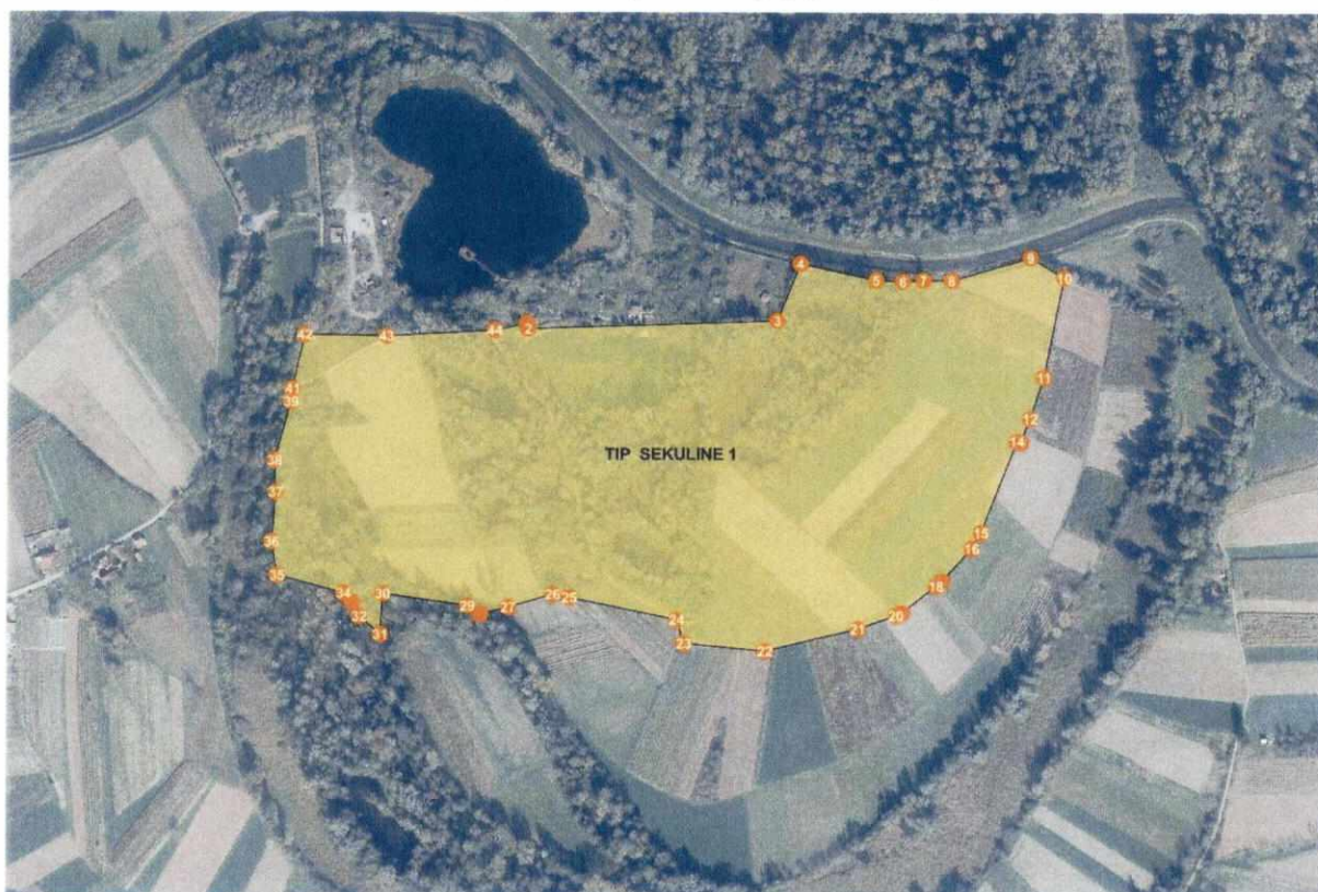
Grafički prikaz istražnog prostora građevnog pijeska i šljunka "Sekuline 1"