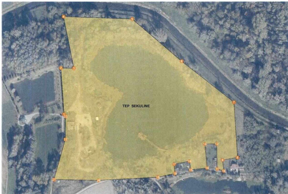
Grafički prikaz eksploatacijskog polja građevnog pijeska i šljunka "Sekuline"